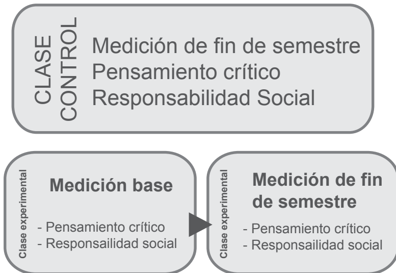
Figura 2. Diseño del proyecto.

El profesor de la sección teórica del curso, tres profesores de la sección de laboratorio y la guía del proyecto (científico informático) trabajaron juntos para desarrollar tales medidas. Como el proyecto empezó en el primer semestre de 2014, después de que la universidad lo financiara, recién se obtuvieron las medidas al final del curso. Primero se creó el autoinforme de fin de semestre, que contenía cuestionarios sobre el uso de la tecnología y Wikipedia, el pensamiento crítico y el sentido de responsabilidad social. Además, se evaluó el pensamiento crítico de las últimas tareas grupales de resumen de artículos usando una rúbrica (ver Anexo A). Las medidas base del grupo experimental fueron similares a las medidas que ya habían sido creadas, pero determinaban las intenciones y experiencias futuras en otros cursos de psicología con pensamiento crítico y un sentido de responsabilidad social. Por otro lado, las medidas al fin de semestre fueron idénticas, con la adición de un pequeño cuestionario online que evaluaba las percepciones de los estudiantes sobre haber completado efectivamente las tareas de Wikipedia. La figura 2 describe el diseño de este proyecto.